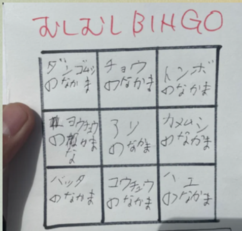
定番プログラムとして定着しつつあるBINGO

2022年4月から2023年3月までに9回の定例活動を実施することができました。一昨年どのような、ただの自然観望会から「ネイチャーゲームの手法」等をふんだんに組み込んだ活動を実施することができました。特に、ネイチャービンゴは本隊の活動内容との親和性が非常に高く、利活用しやすいものであることがわかりました。体調自らネイチャーゲームリーダーの資格を取得したことも加え、2023年度はよりプログラムとしての充実を目指していきます。