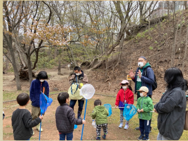
2022年度は「川の活動」からスタート