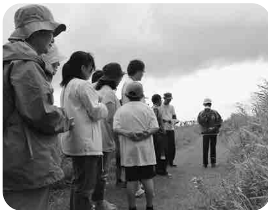
ベニア原生花園でのガイド模様より