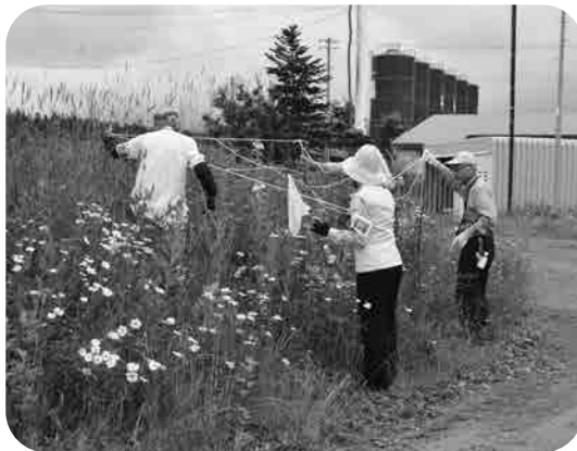
美瑛白金模範牧場緊急モニタリングより