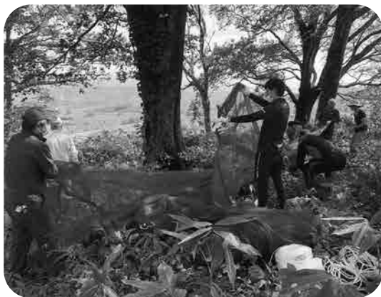
ブナの種子集め作業より