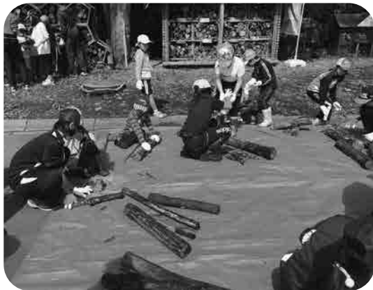
「虫のいえ」制作活動より