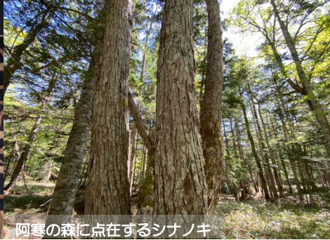
阿寒の森に点在するシナノキ