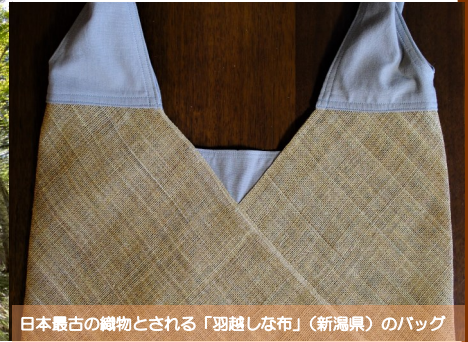
日本最古の織物とされる「羽越しな布」(新潟県)のバッグ