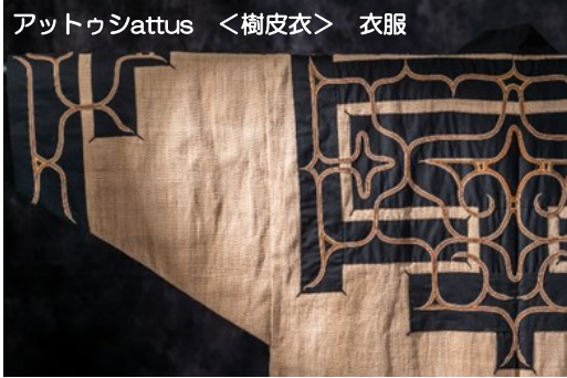
アットゥシattus <樹皮衣> 衣服

このセミナーでは、豊かな森林帯である阿寒の森において夏の草花を間近に触れながら、オヒョウ、シナノキなどの樹木を材料としたアイヌ民族の樹皮衣（アットゥシ）について、日本各地にみられる草木布一例として羽越地方のシナ布や沖縄の芭蕉布などとも関連させながら、森林を育むことと伝統文化の継承やその課題についても触れていきます。